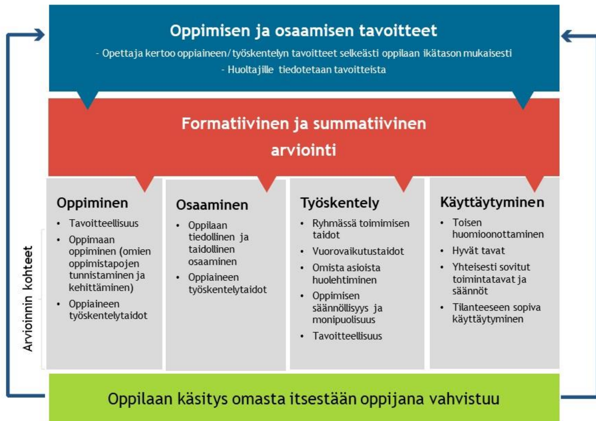
Kuvio 1: Arviointi oppimisprosessin aikana